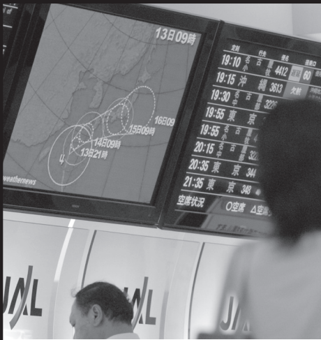
人、モノ、カネをたっぶりかけながら、翌日の天気ですら平気で外す。当たらない予報が経済にどれほどの悪影響を及ぼすか、自覚もなければ反省もない。「与太話」の垂れ流しに、「研究者」5000人とは無駄の極みだ。(110頁)